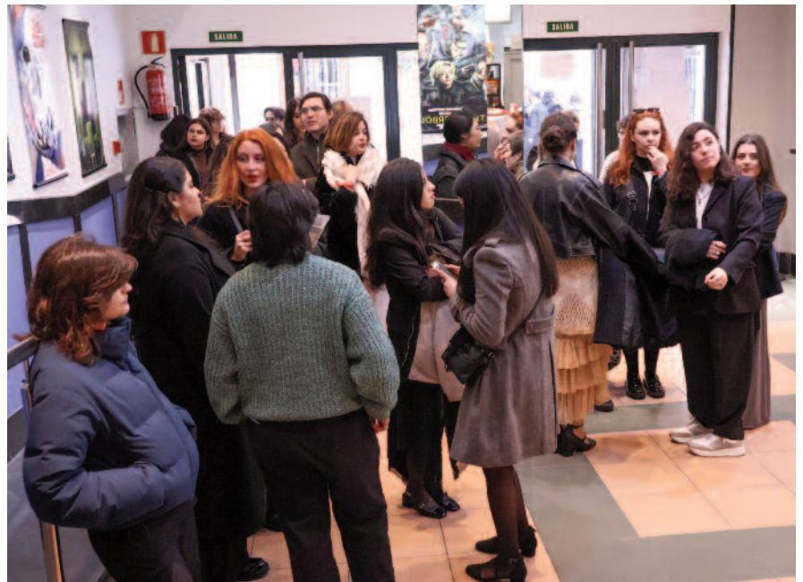
Fachada de los Coliseo, en la calle Simón Ruiz, y público en el vestíbulo de los multicines antes de una proyección de esta 38 SECIME