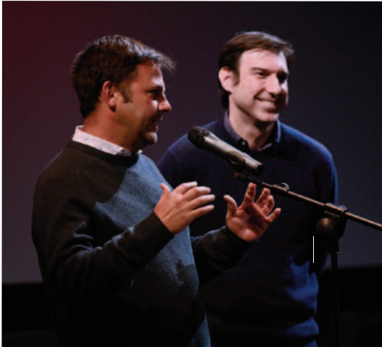
Los productores de All You Need Is Love (D. Ruz)