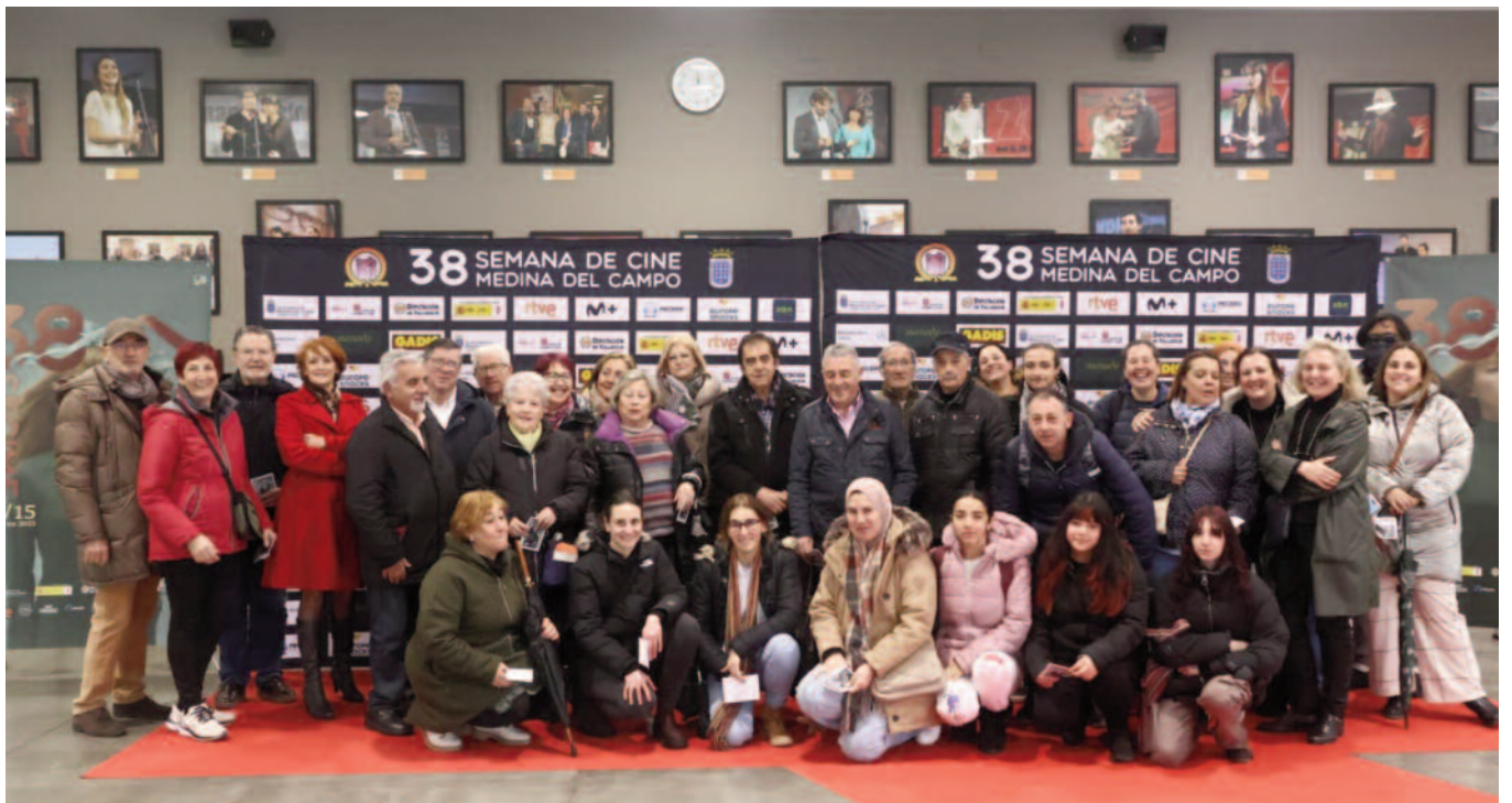
Grupo del Centro de Educación de Adultos Bernal Díaz del Castillo antes de la sesión del Certamen Internacional