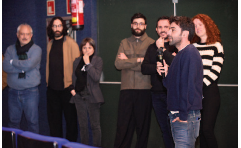
Cortometrajistas de Castilla y León en la segunda sesión del Coliseo