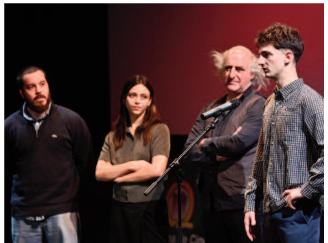
Equipo de Pagliacci , de Sebi Escarpenter