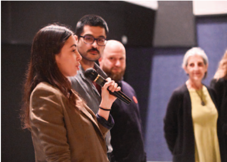
Autores de cortometrajes de Castilla y León en la sesión del Coliseo