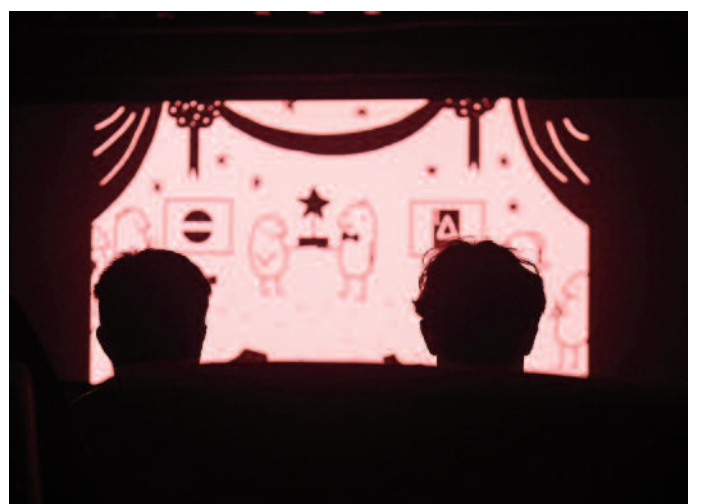
Momento de una proyección del Certamen Internacional