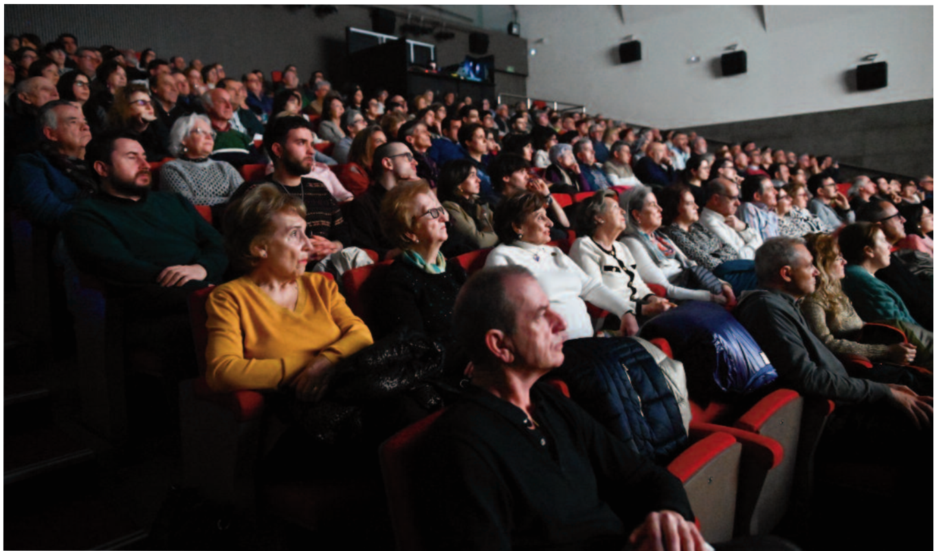
El patio de butacas del Auditorio Municipal Emiliano Allende repleto de público en una de las sesiones