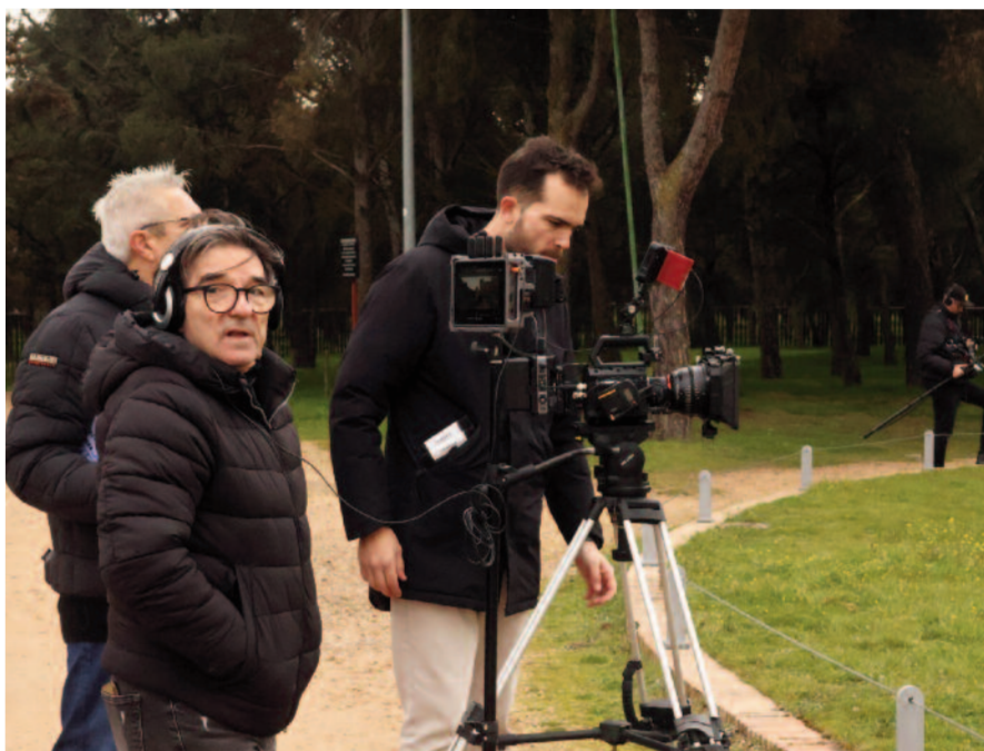
Tolentino en el entorno del castillo de la Mota para rodar La última partida

Esa pasión que ha plasmado en varias publicaciones terminó por llevarlo detrás de la cámara con el documental nominado al Goya, Un blues para Teherán (2020), y participa en la Maratón mientras trabaja en su segundo largometraje, Mar Rojo .