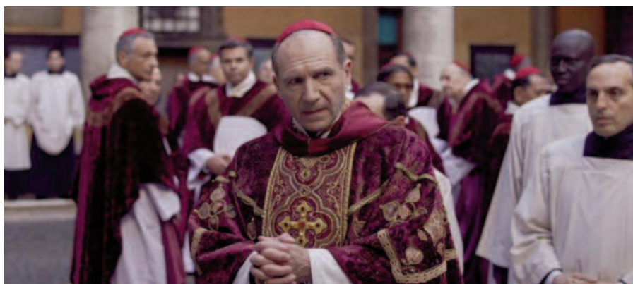
Ralph Fiennes en Cónclave , de Edward Berger

Auditorio Municipal E. Allende Miércoles 12, 16.30 horas