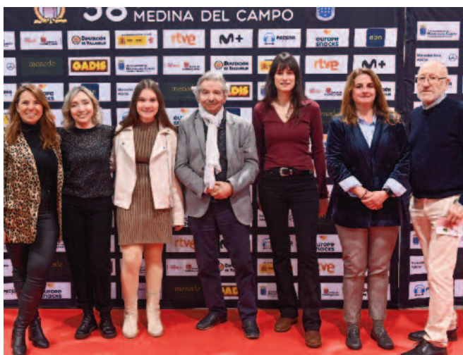
Equipo de El nudo de Ángela , de Diana Rojo con Allende