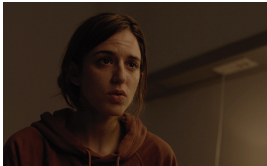
Fotograma de Pentimento , Roel de Oro